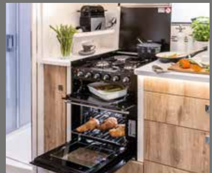
Keukenzuil/fornuiscombinatie (met grill, gasbakoven, 3-pits kookplaat)