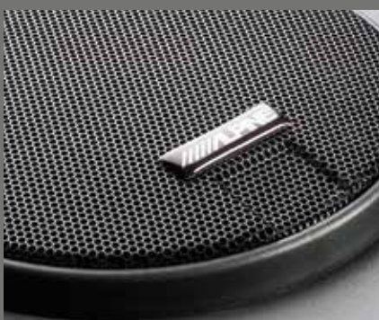
Alpine Dolby surround luidsprekersysteem