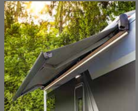
Luifel – optioneel met geïntegreerd LED-verlichtingsprofiel