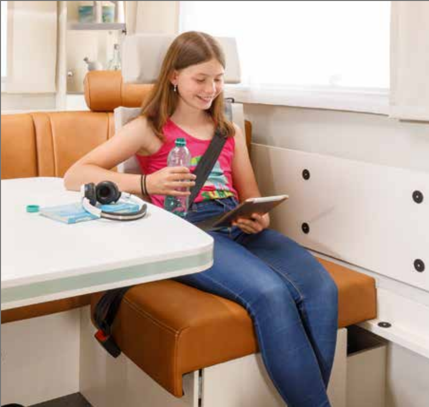
Extra zitplaatsen met veiligheidsgordel bij alle FRANKIA PLUS-plattegronden