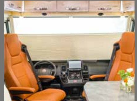
Elektrisch verduisteringsplissé aan de voorkant met privacy- en zonnenschermfunctie (serie bij Luxury)