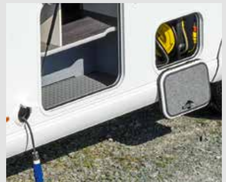
Zelfoprollende kabelhaspel met 15 m kabel en centrale voorziening