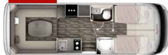
I 740 PLUS