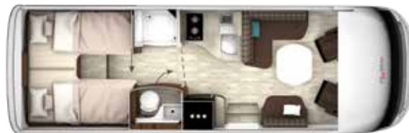
I 740 GD