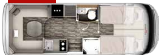
I 680 PLUS