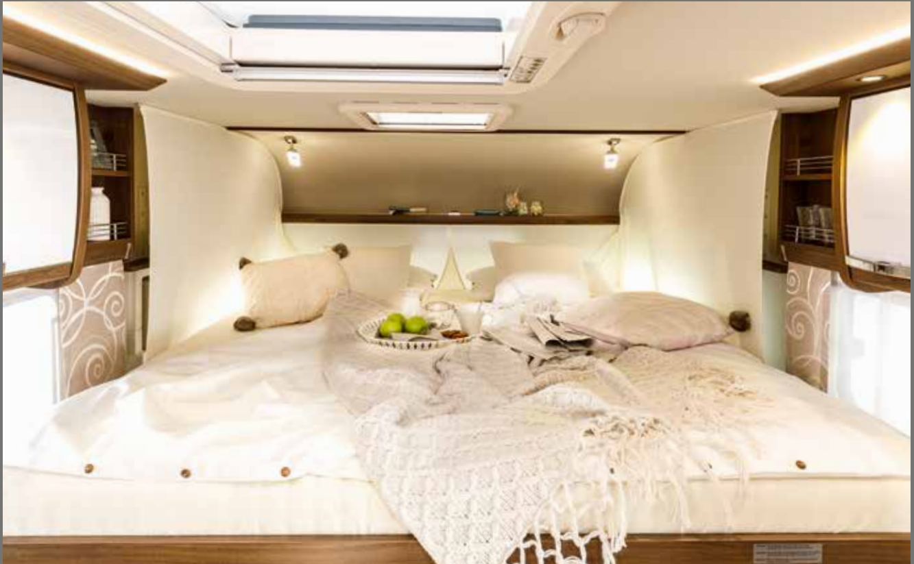
Ideaal voor dwars- en lengteslapers: uittrekbaar FRANKIA-duobed (2x 2 m)