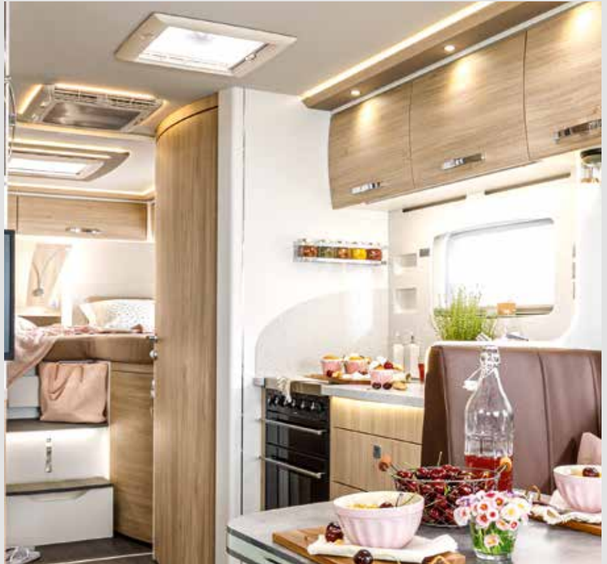
Passend voor elke stemming: de dimbare LED-verlichting