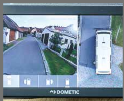
Alles in het oog: bird-view-cam met 360°-view en groot display