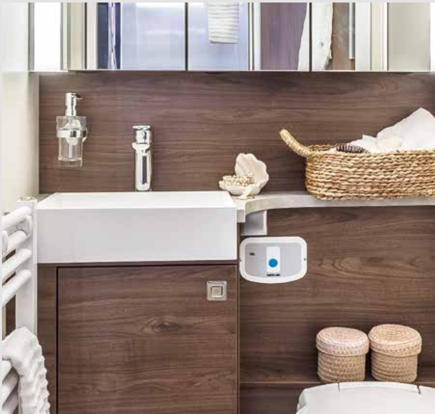
Harmonieus opfrissen: hoogwaardige kranen in de FRANKIA-wellnessbadkamer