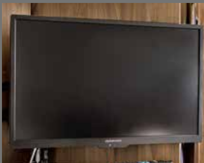
Alphatronics-flatscreen SL-24" met DVB-S2/T2/C-tuner, dvd-speler en Bluetooth