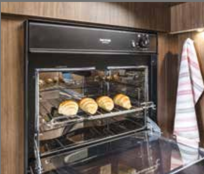
Geïntegreerde bakoven van Thetford