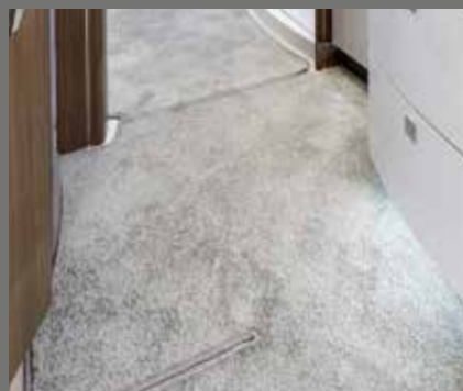
Onderhoudsarme vloerbedekking in de gehele interieurruimte