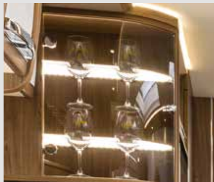
Exclusieve kast met glazen deuren voor uw FRANKIA-wijn glazen