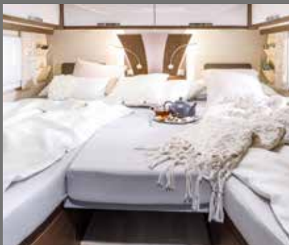
Veel ruimte: bedverbreding voor aparte bedden (GD)