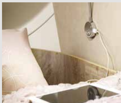
In elke FRANKIA-camper: meerdere praktische USB-contactdozen