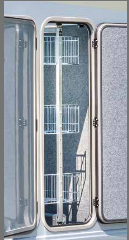
Comfortabel en praktisch apothekersrek voor de garage