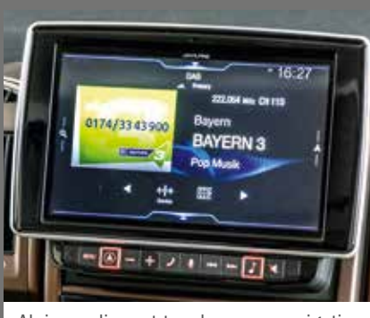
Alpine radio met touchscreen, navigatie, dvd/cd-speler, DAB/DAB+, Bluetooth en nog veel meer