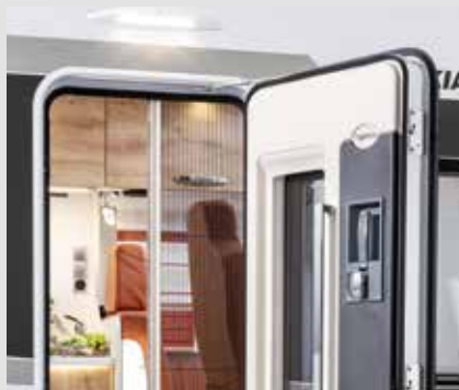
Praktische bescherming: in de opbouwdeur geïntegreerde hor