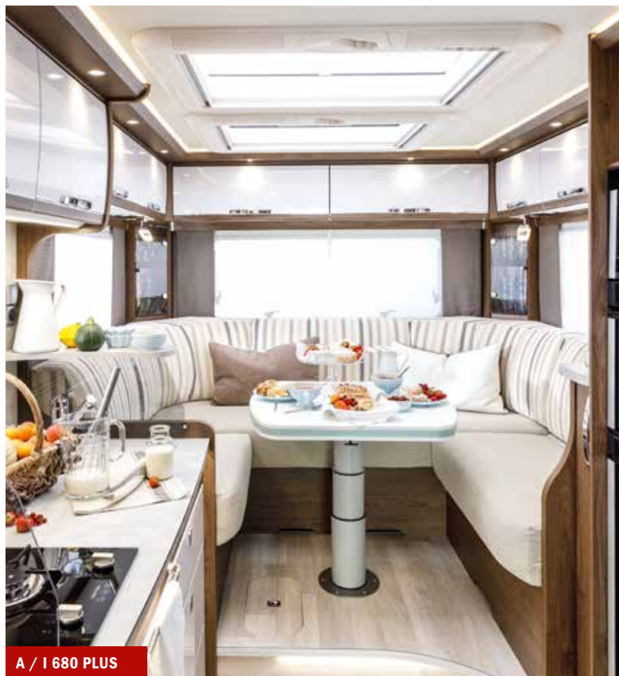
A / I 680 PLUS

Rondzitgroep op Fiat Ducato in drie plattegrondlengtes. De 680 PLUS en 740 PLUS is behalve als integraalmodel ook leverbaar als alkoofmodel