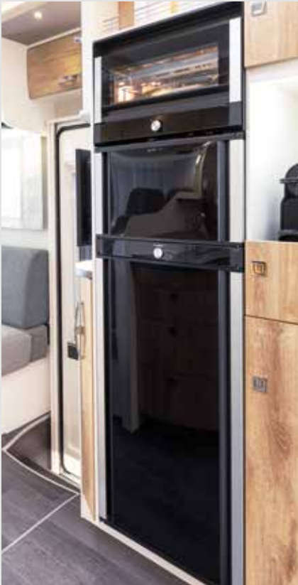
Koelkast en vriesvak in de TecTower kunnen nu aan beide kanten open