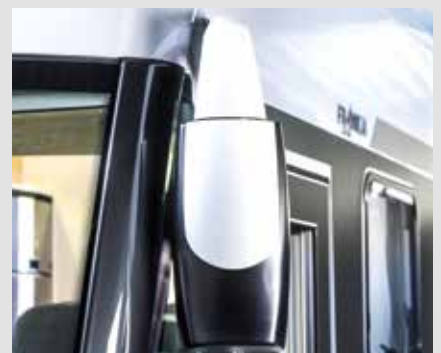
Buitenspiegels elektrisch verstel- en verwarmbaar