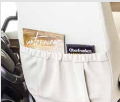
Praktisch: vakken op de bestuurdersstoelen (bij alle integraalmodellen van FRANKIA)