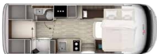
I 680 SG