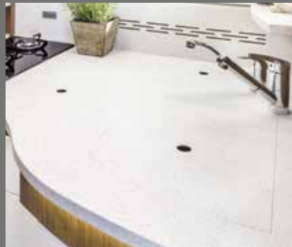
Onderhoudsarm werkblad – bijv. van hoogwaardige minerale grondstof