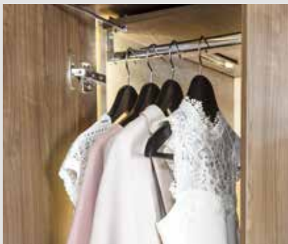
Ruime kledingkasten met aangename binnenverlichting