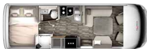
I 740 BD