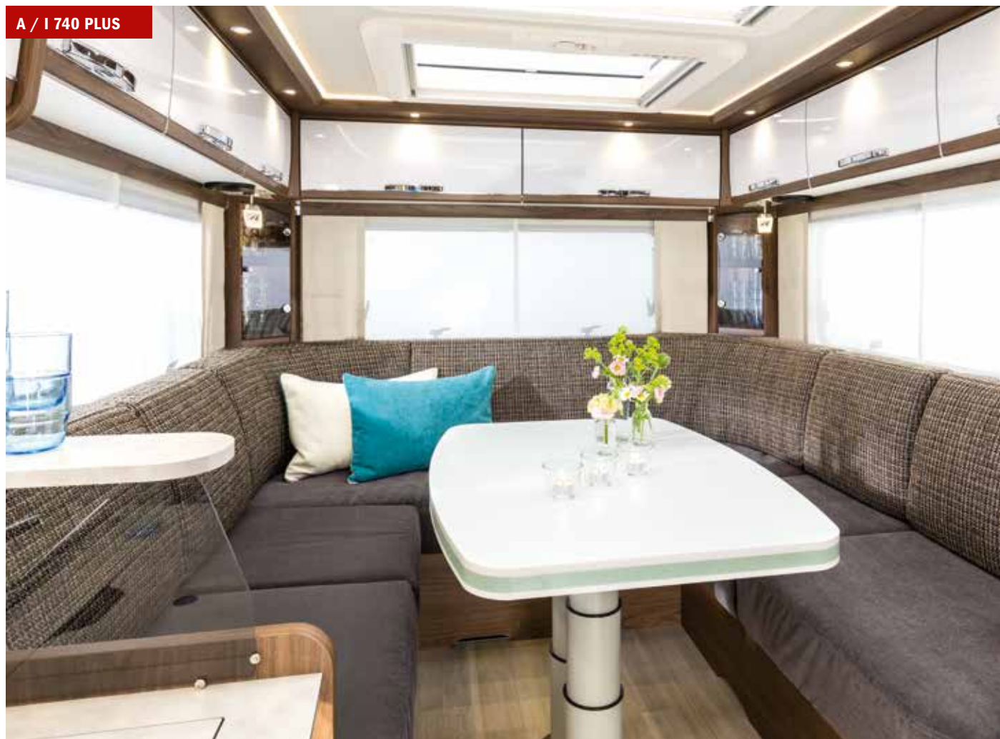
A / I 740 PLUS

Hier speelt het leven zich af: in uw FRANKIA-rondzitgroep. Om ervoor te zorgen dat het centrum van uw F-Line perfect bij u past, heeft u een enorme keuze – uit drie varianten in vijf plattegronden.