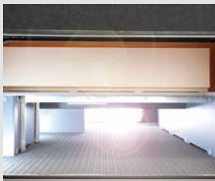
FRANKIA dubbele bodem: traploos doorlopende hoogte van 35 cm, verwarmd