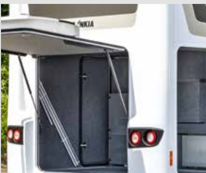
Beladen van de garage en uitladen door verstelbaar achterluik en zijluiken