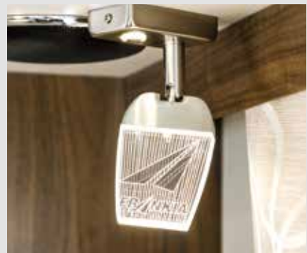
Dimbare leeslampjes in FRANKIA-design met nachtlampfunctie