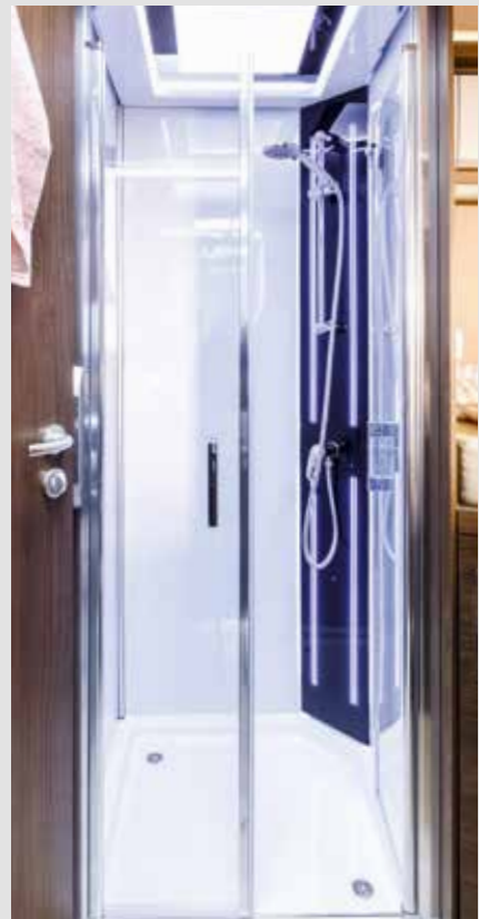
Douchecabine met sfeerverlichting