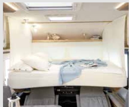
Elektrisch verstelbaar hefbed bij integraalmodellen