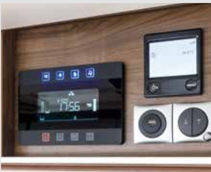
Centrale besturing – goed zichtbaar en eenvoudig te bedienen