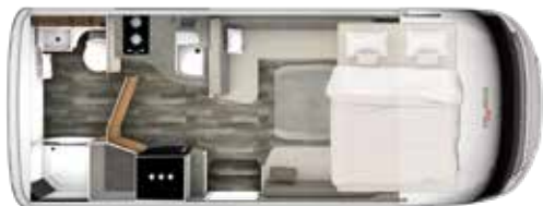
I 640 SD